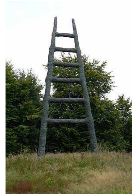
Armando - De trap