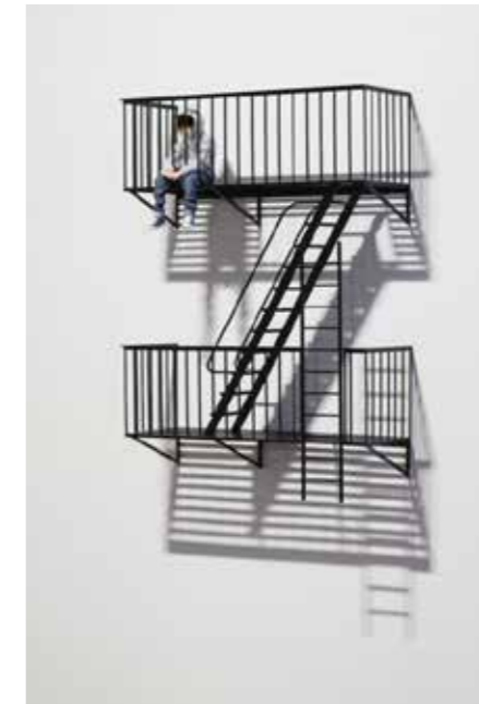
Elmgreen&Dragset - The Future