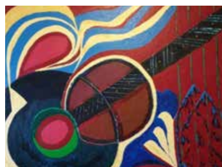
Maria ter Zee Kerk Nieuwe Zeeweg 75