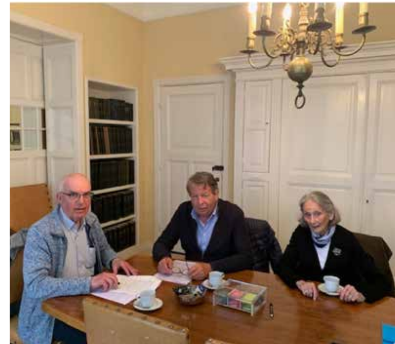
Ondertekening van de statuten bij de notaris 55+ Noordwijk

Niet van alle verenigingen zijn de statuten vastgelegd in een notariële akte. In principe kunnen deze verenigingen als vereniging bestaan. Een dergelijke informele vereniging kan echter geen onroerend goed aankopen. Ook zijn er risico's voor de bestuursleden. Bij schade - door de vereniging toegebracht aan derden - zijn de bestuursleden aansprakelijk.