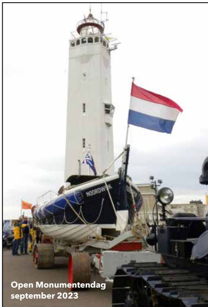
Open Monumentendag september 2023