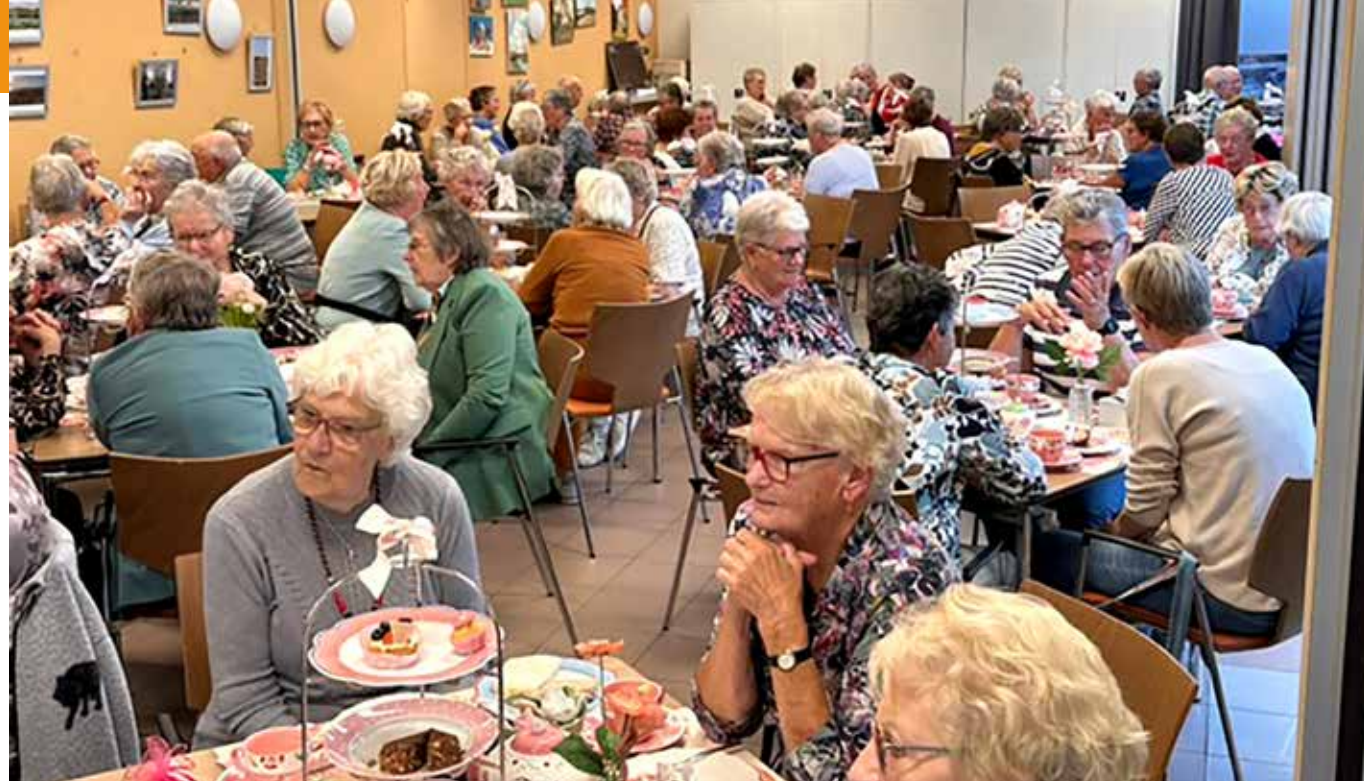
Vrijdag 13 oktober was er een heerlijke High Tea in de Wieken