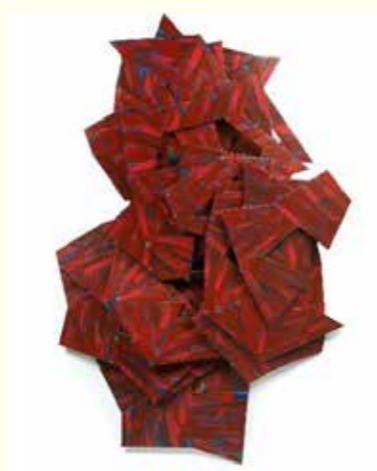
Jaap van den Ende

In het Prinsenhof hebben we o.a. de tentoonstelling "De Kunstparade - verrassend kleurrijk" bezocht. Een omvangrijke selectie kunstwerken, van gevestigde en opkomende kunstenaars die een bijzondere band met Delft hebben.