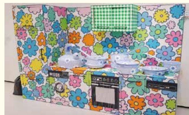
I hit you with a flower